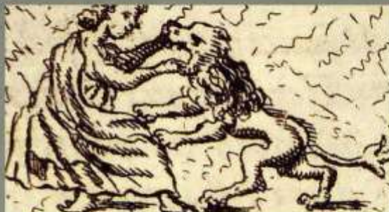
Cnoty kardynał z grobu Papieża Klemensa II w kamieniu w Bambergu

Cnota moralna, która polega na umiejętności podjęcia dobrej decyzji mimo niesprzyjających warunków, zarówno wewnętrznych jak i zewnętrznych. Cnota męstwa czyni zdolnym do stawienia czoła próbom i narażenia się na nieprzyjemne konsekwencje, w imię wyższych wartości.