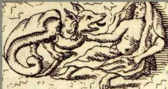
Cnoty kardynalne z grobu Papieża Klementyna II w Bambergu w Bambergu

cnota moralna, która wyraża się umiejętnością dobierania właściwych środków prowadzących do celu. Jest zasadą doskonalenia postępowania człowieka.