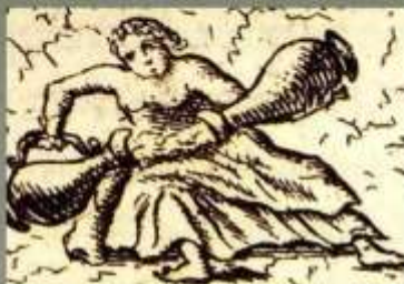
Cnota kardynała z grobu Papieża Klementa II w katedrze w Bambergu

Cnota moralna, która polega na używaniu rozumu dla panowania nad własnymi instynktami i potrzebami. Oznacza umiejętność korzystania z dóbr materialnych zgodnie z ich celem. Zapewnia panowanie woli nad popędami. Stawia pragnieniom pewne granice.