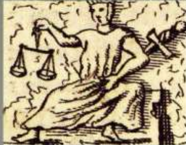
Cnoty kardynalne z grubej Papieża Klementa II w katedrze w Bambergu

cnotą moralną, która polega na stałej i trwałej woli oddawania Bogu i bliźniemu tego, co im się należy. Sprawiedliwość jednak niesie z sobą nie tylko zmagania by dobrze postępować, ale także obejmuje osąd wartości – że jest dobro i zło i że musimy pomiędzy nimi wybierać. Tę właśnie kwestię, nasza kultura „nie osądza” często odrzuca. Sprawiedliwość naprawdę łączy cztery kardynalne cnoty, ponieważ mówi nam że dobre rzeczy nie są zarezerwowane tylko dla mnie, ale są one dla wszystkich. Muszą tak działać aby korzyść odnieśli także inni, nie tylko ja sam.